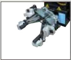
알루미늄 림 프로텍션 가드