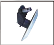
링 타입 휠 비드브레이킹 디스크