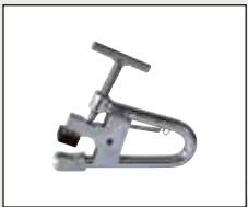
알루미늄 림 비드라킹 클램프